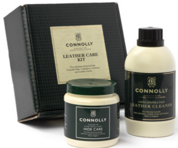
Connolly Leather care kit Part no. 355874

Caring for the leather: Leather is a natural product and needs looking after. Keep the leather clean, and avoid overexposure to the sun which will dry it out, leading to cracks. While there are many leather care products on the market, we recommend Connolly leather car kit, 'Hide Food', part no. 355874. Treating the leather with hide food once a month will keep it soft and supple.